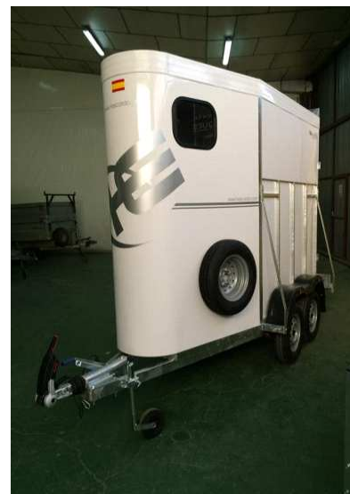
ESTABILIZADOR DE ENGANCHE