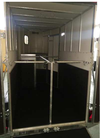
REFUERZOS INTERIORES DE TABLERO Y RAMPA TRASERA ESCAMOTEABLE