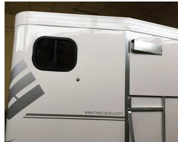
VENTANA FRONTAL CORREDERA Y ENTRADAS DE AIRE LATERALES