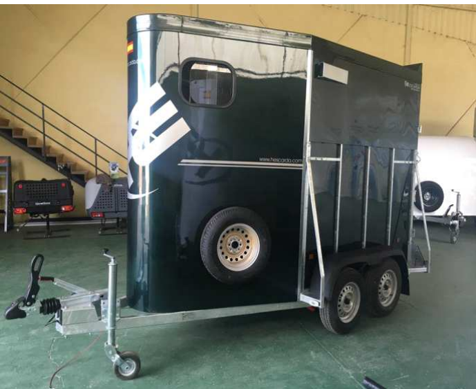
FORRADO DE POLIESTER