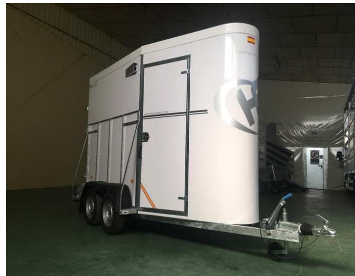
PUERTA DELANTERA DE ACCESO A VAN